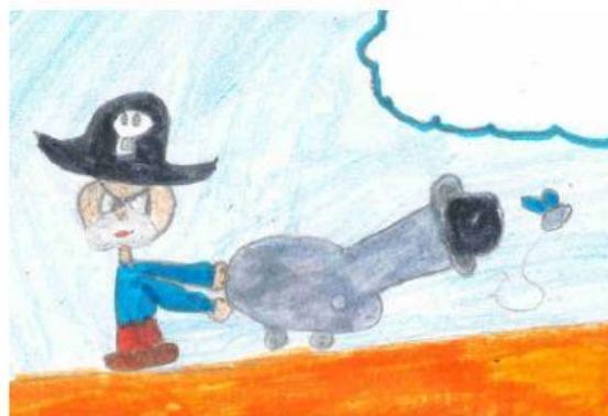
Imagen: Carmen Gragera Moreira. 8 años

¿De qué 4 formas intentó cazar las moscas Barbaplata?