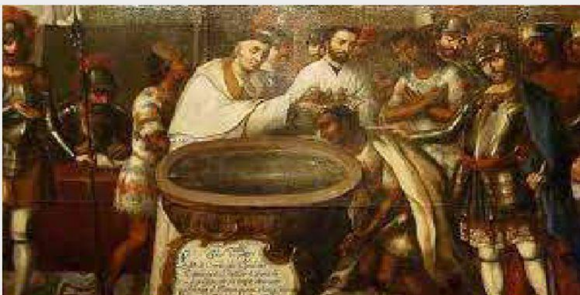
Los indígenas eran catequizados y bautizados.