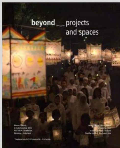
Gambar Festival Damar Kurung

Selain pudak, Gresik juga memiliki ciri khas yang berupa lampion damar kurung. Sekarang berkumpul dengan kelompok yang telah ditentukan dan ayo kita bermain peran mengenai kegiatan ekonomi yang berhubungan dengan lampion damar kurung!