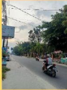
Gambar 2. Kondisi jalan yang sepi oleh pengendara motor