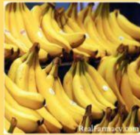
Gambar 3. Buah pisang yang masih segar