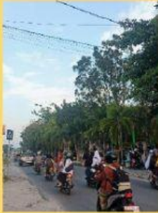
Gambar 1. Kondisi jalan yang ramai oleh pengendara motor