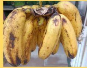
Gambar 4. Buah pisang yang mulai membusuk