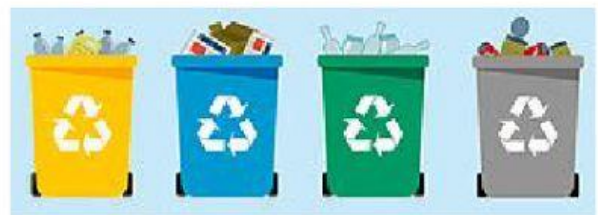
La regla de las tres erres (adaptación)

Consiste en tatar los materiales de los que están hechos los objetos que desecharmos, como papel, metales, vidrio o plástico, para fabricar nuevos productos, como cuadernos, envases, ropa, etc. De este modo se salvan los materiales útiles y el daño medioambiental que produce su eliminación (gases y otras sustancias tóxicas) es menor. Del papel y del cartón se puede recuperar hasta el 50% del material a través del reciclaje, si no están revueltos con basura que los moje o manche. Está en tus manos seleccionar y separar los desechos de tu hogar, es decir, utilizar adecuadamente los contenedores: los amarillos, para depositar metales y plásticos; las azules, para papel, cartón y derivados; los verdes, para vidrios, y los grises para desechos orgánicos.