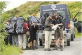
to go on an expedition (wybierać się/ iść /jechać na wyprawę/ ekspedycję)