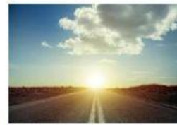
a journey (podróż)