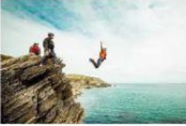
an adventure (przygoda)

Przed rozpoczęciem zajęć zdalnych, przyjrzyj się poniższym ilustracjom i zwrotom: