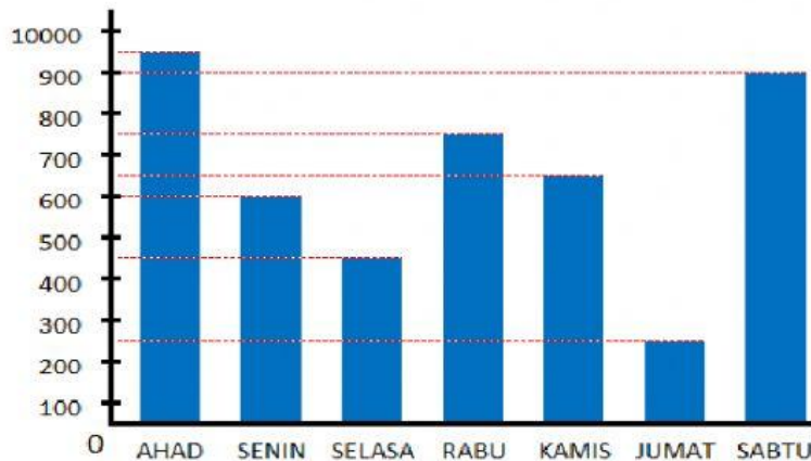
DIAGRAM BATANG DATA JUMLAH PENUNJUNG OBYEK WISATA DALAM SATU PEKAN

Perhatikan gambar berikut untuk mengerjakan soal no 6 - 10 !