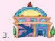
3. shopping centre