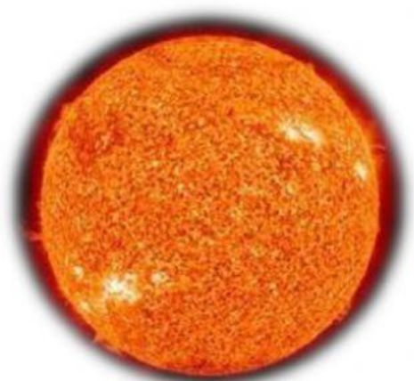
COMPOSICIÓN QUÍMICA DEL SOL