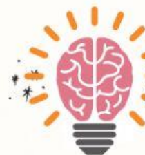
Menentukan Tema Gambar