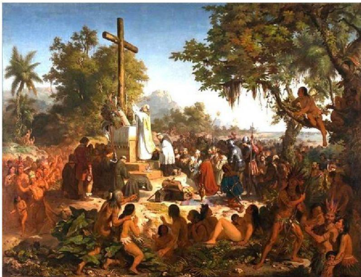
"Primeira Missa no Brasil" (1860), obra do pintor Victor Meirelles

O frei Henrique Coimbra foi quem rezou a primeira missa nas novas terras descobertas.