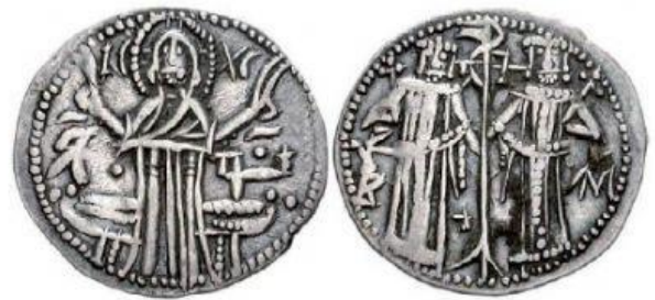
Сребърна монета на цар Иван Александър