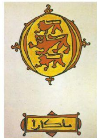
Гербот на България според един арабски пътешественик от времето на цар Иван Шишман