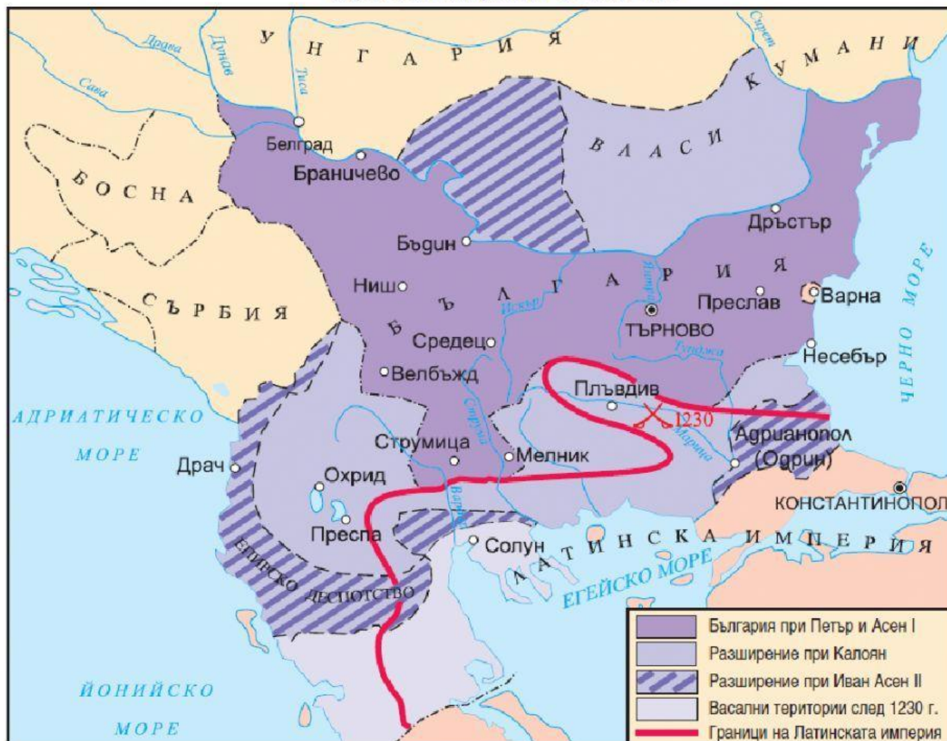
Карта на България до Иван Асен II

България пак станала голяма и силна държава и всички българи били отново освободени и обединени под една власт. Затова, подобно на Симеон Велики, Иван Асен II се подписвал като „цар и самодържец на българи и ромеи“. Не само българите, но и останалите народи в обширното царство го славели като добър и справедлив владетел.