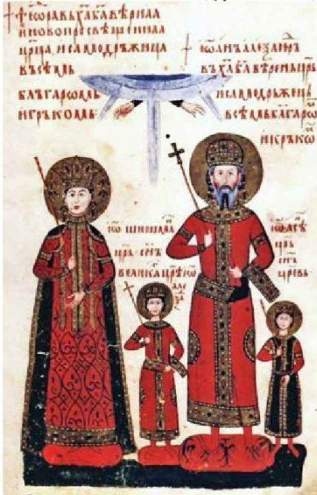
Иван Александър и семейството му – страница от Лондонското четвероевангелие

Иван Александър бил покровител на културата, която преживяла своя втори „Златен век“. Писателите от Търновската книжовна школа сътворили безценни книги, царят подкрепял видни духовници, като св. Григорий Синаит и св. Теодосий Търновски. Портрети на Иван Александър са запазени в Бачковския манастир, скалната църква при Иваново, Русенско, в т.нар. Лондонско евангелие, Манасиевата летопис и други паметници на средновековната ни култура и изкуство.