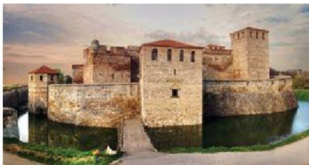
Видинско царство – Видинската крепост в наши дни

Всички тези Българии обаче били малки, слаби и враждували помежду си.