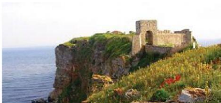
Добруджанско деспотство – крепостта на нос Калиакра