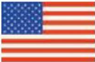
Estados Unidos de América

Selecciona las banderas de los países con los que México estableció los tratados comerciales denominados TLC.