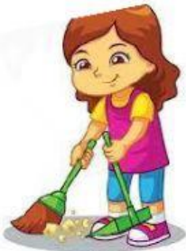
Menyapu bilik masakan.