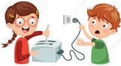
Bermain dengan alat masakan elektrik.

Padankan gambar dengan perlakuan yang betul atau salah.