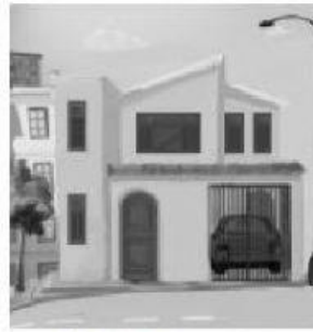
En la casa de Alejandra.