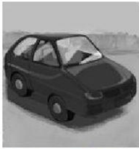
En el auto del papá de Alejandra.