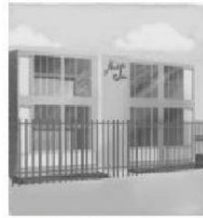
En el colegio.