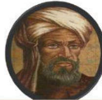
Muhammad Ibnu Musa Al Khwarizmi