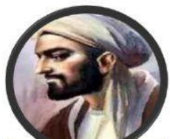
Jabir Ibn Hayyan