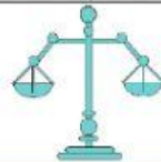
เครื่องตวง