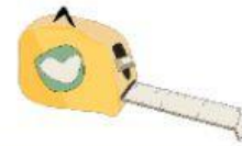
ตลับเมตร