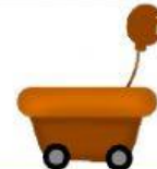
สีน้ำตาล