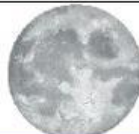
ดวงจันทร์