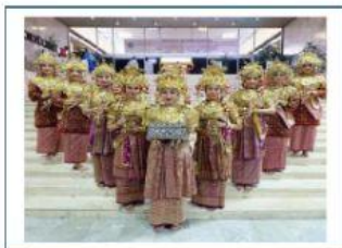
Tari Gending Sriwijaya, Sumatera Selatan