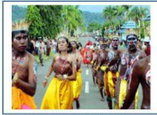
Tari Yospan, Papua

5. Berdasarkan video pembelajaran di atas, jodohkanlah gambar dan kata dengan tepat!