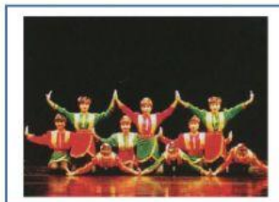
Tari Saman, Aceh