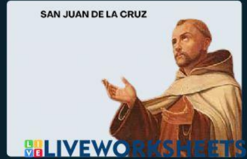
SAN JUAN DE LA CRUZ