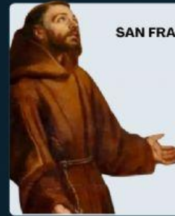
SAN FRANCISCO DE ASIS

Si nosotros descubrimos algo de bondad, belleza, verdad y armonía, no es por las cosas mismas.