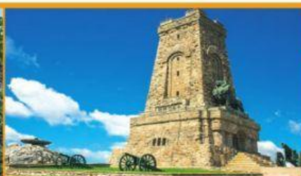
Паметникът на Васил Левски