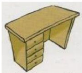
scrivania / vecchia