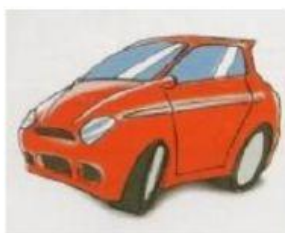
macchina / nuova

3 Osservate i disegni e con l'uso dei possessivi costruite delle frasi come: "La tua penna è blu"