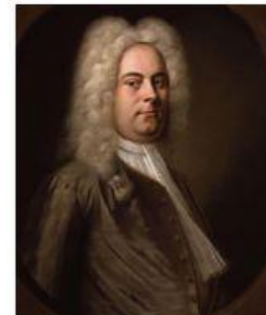
Georg Friedrich Händel

Skladao ga je veliki barokni skladatelj Georg Friedrich Händel .