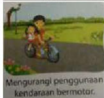
d. Mengurangi penggunaan kendaraan bermotor.