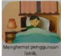
c. Menghemat penggunaan listrik.