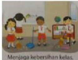
a. Menjaga kebersihan kelas.