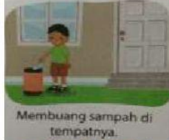
b. Membuang sampah di tempatnya.