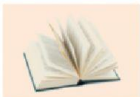
le livre / les livres