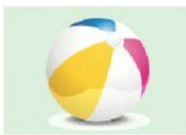
le ballon / la ballon