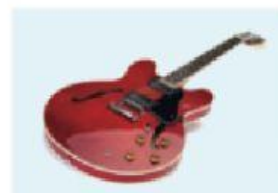
le guitare / la guitare