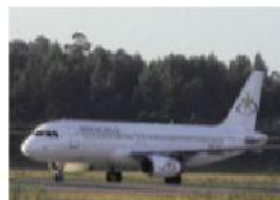
l'avion / le avion