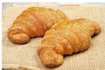
D. Un / Des croissants.