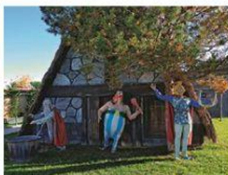
Une / Des personnages de BD