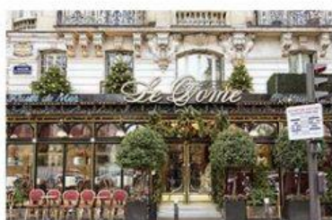
Un / Une restaurant de Paris