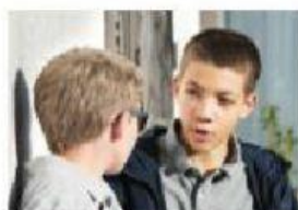
le garçons / les garçons