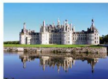
Un / Des château de la Loire :