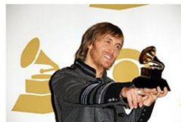
F. Une / Des célébrité française : David Guetta.