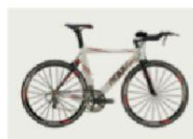
le bicyclette / la bicyclette