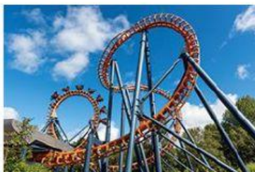
E. Un / Une parc d'attractions.