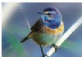
l'oiseau / le oiseau