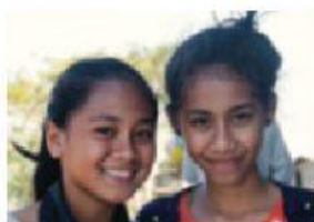
la filles / les filles