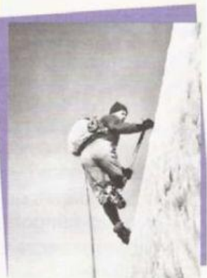
e. Maurice Herzog (France)