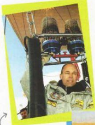
Bertrand Piccard (Suisse)

Maintenant, observe ces 8 photos et associe les exploits et découvertes précédents aux explorateurs et grands voyageurs correspondants.