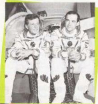
g. Jean-Loup Chrétien et Patrick Baudry (France)