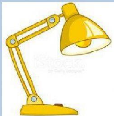
lá u mpara