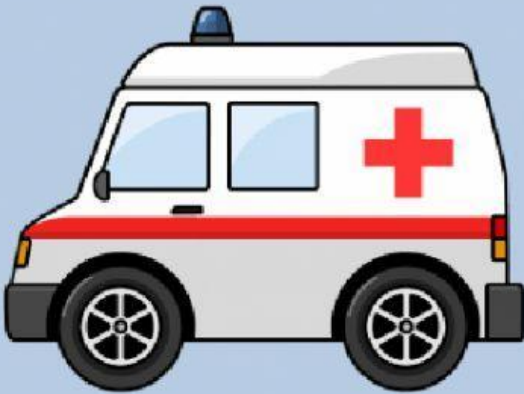
amb u lancia