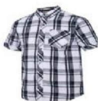
КЛЕТЧАТЫЙ; В КЛЕТКУ