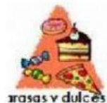
carasas y dulces