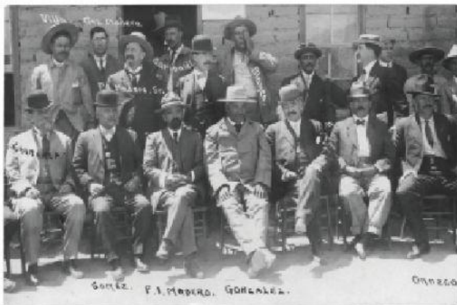
Líderes de la Revolución Mexicana

Foto publicada bajo licencia Creative Commons