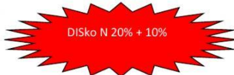
Promosi Toko B

Jason ingin membeli 3 buah jaket dengan uang yang ia miliki sejumlah Rp200.000,00. Jaket di Toko A seharga Rp 100.000 per buah.