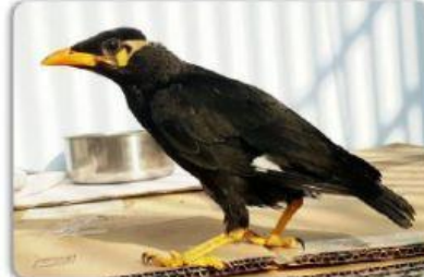
chim ? .....