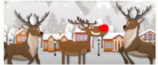
Los renos se reían de Rudolph