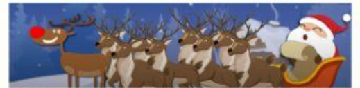
Al final, Rudolph ayuda a Papá Noel