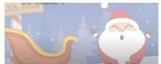
Papá Noel se pierde en la niebla