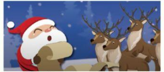
Papá Noel se prepara para viajar