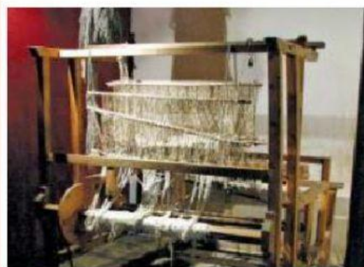
Reproducción de un telar colonial