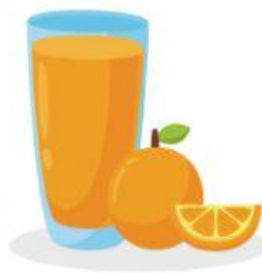
1 spremuta d'arancia