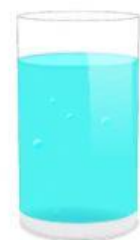
1/2 minerale naturale