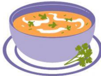
minestra di fagioli