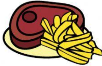
1 cotoletta + patatine