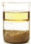
Aceite - agua - arena