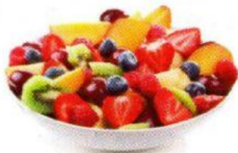
Ensalada de frutas

1 Analiza las imágenes y completa los siguientes cuadros: