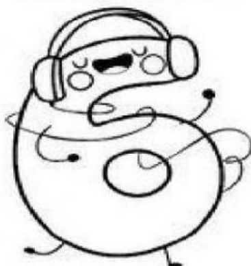
Tabla del 6