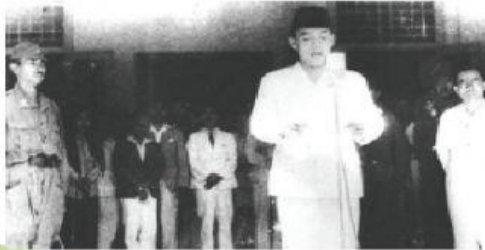
Sumber gambar: https://www.goodnewsfromindonesia.id/2016/08/19/ , diunduh tanggal 10 juli 2017 jam 07:48 WIB.

Setiap bangsa pasti menginginkan kemerdekaan karena kemerdekaan merupakan cita-cita dan tujuan yang ingin dicapai. Begitu juga dengan bangsa Indonesia. Bangsa Indonesia pernah mengalami masa penjajahan cukup lama dan membuat rakyatnya menderita. Karena alasan itulah bangsa Indonesia bekerja sama, bahu membahu dengan sekuat tenaga berjuang untuk memperoleh kemerdekaannya.