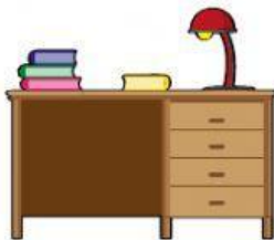
Un espacio para estudiar