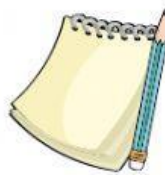
Cuaderno de apuntes y lápiz