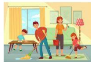
ayudar en el aseo