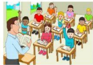
cumplir con mis tareas