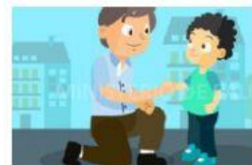
respetar y obedecer a los padres