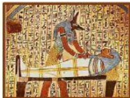
Técnica para momificar