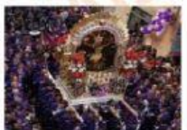
D. Señor de los Milagros.