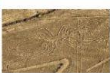
F. The Nazca lines.