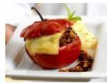
C. Rocoto Relleno.