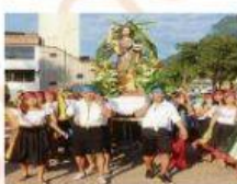
B. San Juan