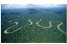
E. The Amazon.