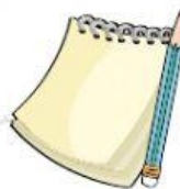
Cuaderno de apuntes y lápiz