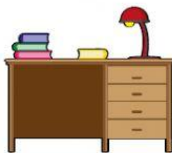
Un espacio para estudiar