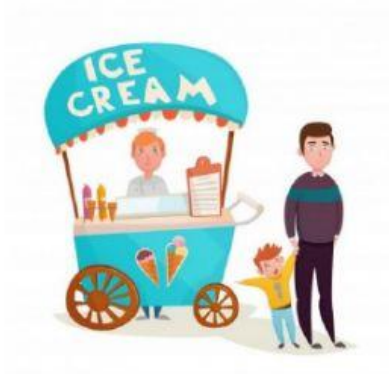
Porcentaje de paletas

A partir del gráfico circular conteste lo siguiente: