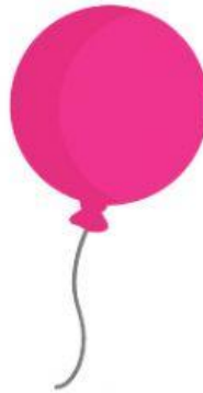
AIRE EN UN GLOBO