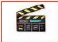
ins Kino gehen