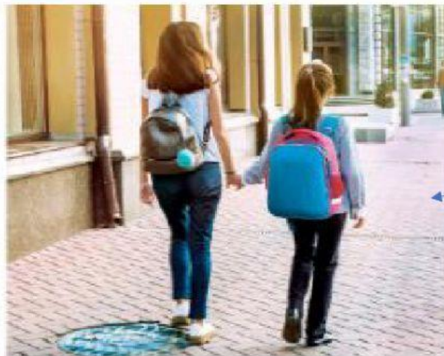
Dos niñas se dirigen al colegio por una de las vías seguras del Colecamins.

La receta básica del plan de rutas escolares seguras, que han llamado Colecamins, tiene el apoyo del Ayuntamiento y está siendo exportada a otras zonas de Valencia, y consiste en hacer aceras más anchas, mejorar la visibilidad de las intersecciones, dar prioridad a