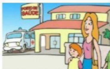
POSTO DE SAÚDE

7_ QUAL O LOCAL ADEQUADO PARA TOMAR VACINA?