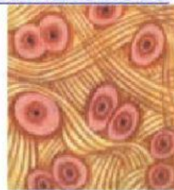
FIBROSO (discos intervertebrales)