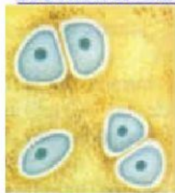
HIALINO (superficies articulares)