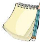
Cuaderno de apuntes y lápiz