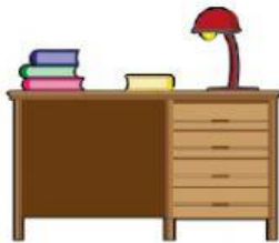
Un espacio para estudiar