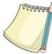
Cuaderno de apuntes y lápiz