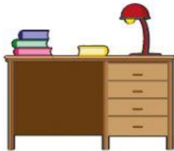
Un espacio para estudiar